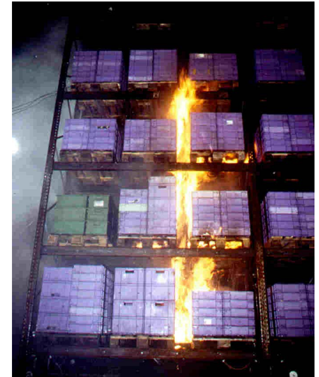
Brand- und Löschversuche mit Sprinklern, Nieder- und Hochdruck-Wassernebel-Löschanlagen (hier: Brand- und Löschversuch am Regallager mit ND-Wassernebel-Löschanlage)