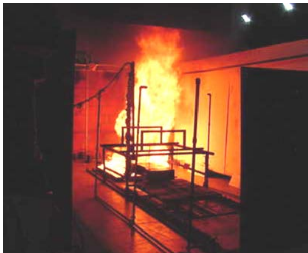
Beflammung einer PKW-Antriebsbatterie (Li-Ion); Prüfverfahren ECE R34 und R100