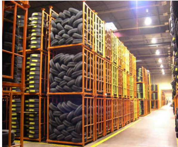
Entrauchungs- und Löschkonzepte (hier: Reifenlager)