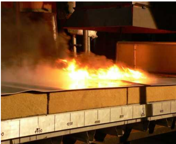
Brandprüfung DIN SPEC 91187 (Test3)