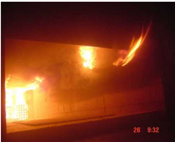
Prüfung DIN 18234 Stahlleicht-, Sandwich- und Holzdächern